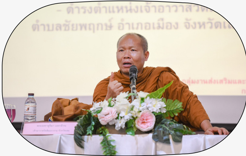
พระมหาสุริยา แยกอ้วน บรรยายเรื่องการพัฒนาคุณธรรม จริยธรรม และหลักธรรมทางพระพุทธศาสนา เพื่อปรับใช้ในการดำเนินชีวิตและการปฏิบัติงาน