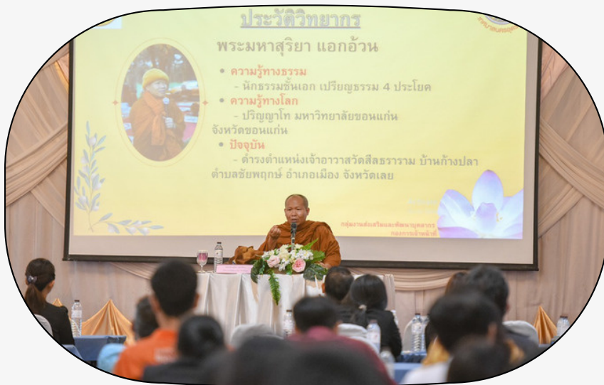
พระมหาสุริยา แยกอ้วน บรรยายเรื่องหลักการใช้พระเดช และการสร้างพระคุณ อย่างมีคุณธรรมในหน่วยงาน